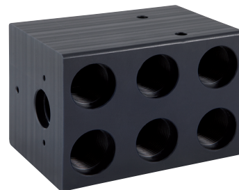
Ventilbox tillverkad av POM.

Kärt barn har många namn brukar man säga. När det gäller Acetalplasterna (POM) stämmer det verkligen väl. Idag säljs materialet i hela världen under flera olika namn som Delrin, Hostaform, Tecaform, Sustarin och Ertacetal. De högkristallina acetalplasternas främsta egenskaper är att de är sega, hårda och är styva med en hög utmattningshållfasthet. De är även kemikalibeständiga och har goda glid- och snäppeegenskaper. En kontinuerlig drifttemperaturer på upp till 100°C är en annan egenskap som gör Acetalplasterna till en allsidig och pålitlig plast. Acetalplasterna finns som rör, stavar och skivor. Det finns idag två huvudformer av acetalplaster - homopolymer och sam- eller copolymer. Vill du veta mer om plaster - kontakta någon av våra tekniska säljare.